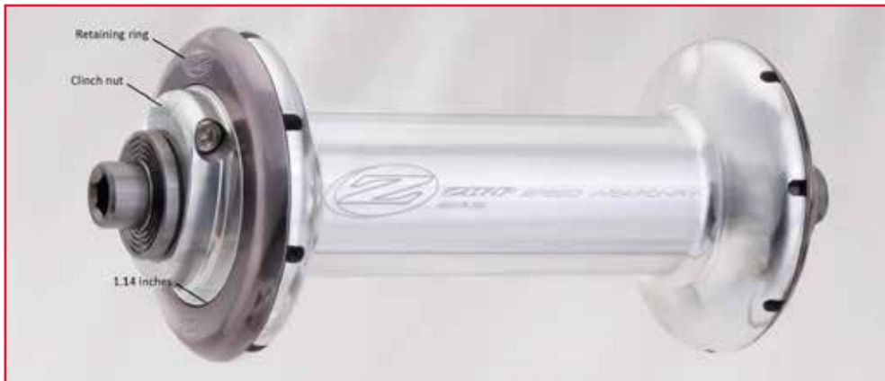
Afbeelding 1 – Zipp 88-naaf van de eerste generatie