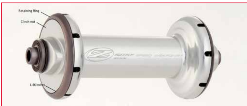
Afbeelding 3 – Probleemloze naaf

ONDERSTAANDE afbeeldingen tonen een Zipp-voornaaf die niet teruggeroepen wordt. Let op de grotere zilveren borgmoer en de smallere flensring.