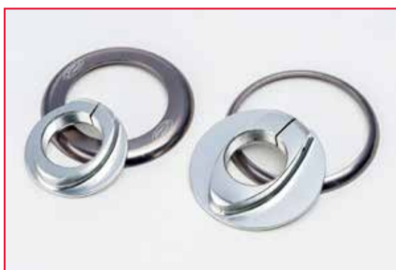
Afbeelding 4 – Links MET probleem, rechts ZONDER probleem

5. De voornaaf die wordt teruggeroepen heeft flensring en moer zoals links afgebeeld (gekleurde flensring met “Z”-logo en een kleinere borgmoer) De delen rechts horen bij een naaf die geen probleem heeft en die niet wordt teruggeroepen. Hier is de moer groter (37 mm), de flensring is dunner en heeft geen “Z”-logo. (Afbeelding 4)